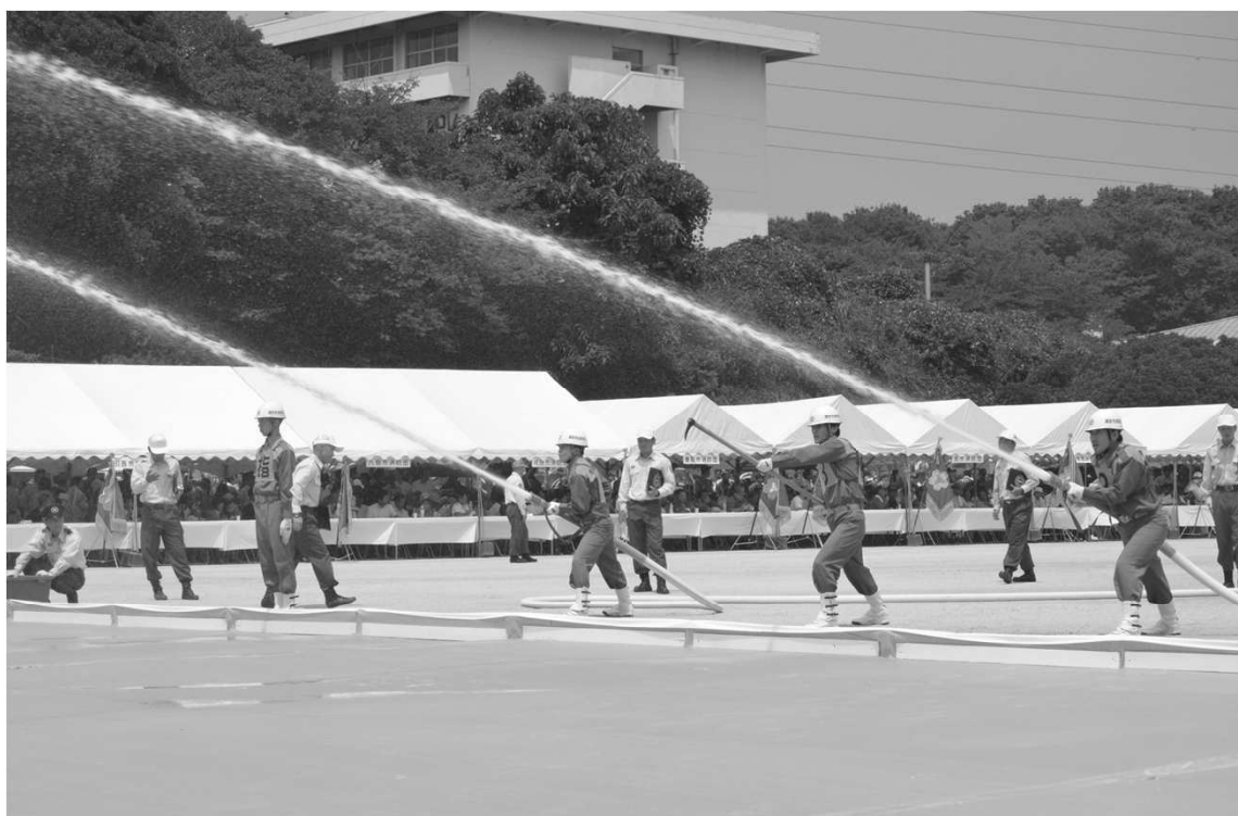
第50回千葉県消防操法大会ポンプ車の部最優秀賞受賞