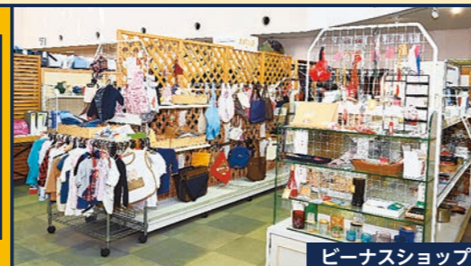
ビーナスショップ

家具・自転車の再生工房があり、きれいに修理した家具の販売や、再生自転車の抽選販売を行っているほか、毎月各種リサイクル教室も開催しています。フロア内にあるビーナスショップでは、家庭で不要になった日用雑貨やおもちゃ、バッグなどの引き取りや販売もしています。