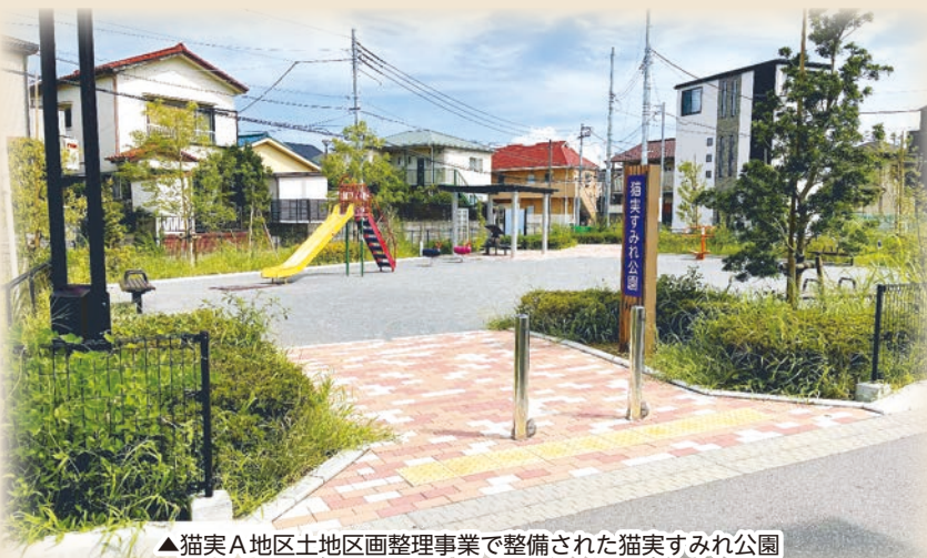
▲猫実A地区土地区画整理事業で整備された猫実すみれ公園

式典会場には駐車場がありません。雨天の場合は、中央公民館で感謝状贈呈式のみ行います