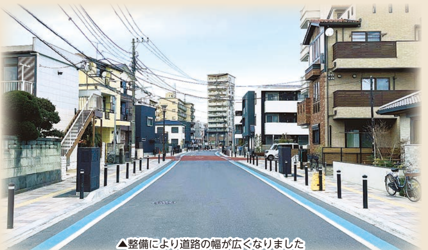
▲整備により道路の幅が広くなりました