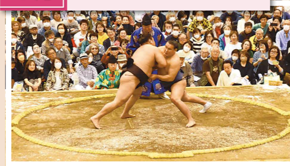
浦安市で初めて巡業が開催され、111人の力士が参加しました。