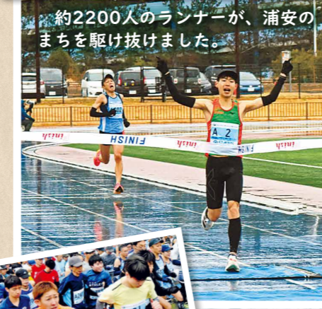
約2200人のランナーが、浦安のまちを駆け抜けました。