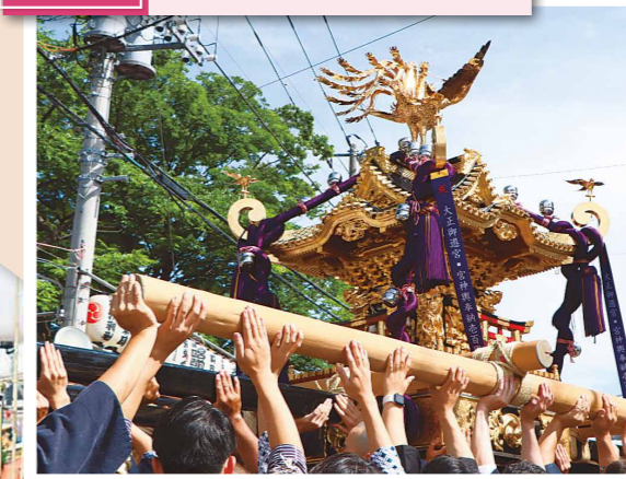
浦安三社(清瀧神社・豊受神社・稲荷神社)で8年ぶりに例大祭が開催され、3日間神輿の渡御が行われました。