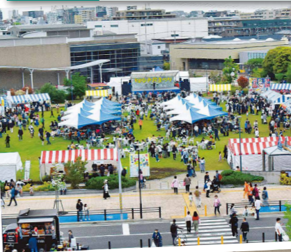
第48回浦安植木まつり、浦安市消防本部設立50周年記念消防広場と同時開催され、多くの方が来場しました。