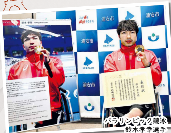
パラリンピック競泳 鈴木孝幸選手

7月26日～8月11日に第33回オリンピック競技大会が、8月28日～9月8日にパラリンピック競技大会がパリで開催され、浦安市ゆかりの選手たちが活躍しました！