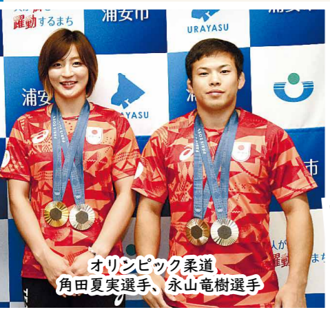
オリンピック柔道 角田夏実選手、永山竜樹選手