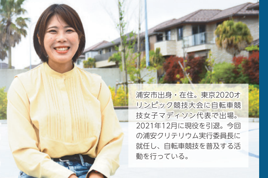
浦安市出身・在住。東京2020オリンピック競技大会に自転車競技女子マディソン代表で出場。2021年12月に現役を引退。今回の浦安クリテリウム実行委員長に就任し、自転車競技を普及する活動を行っている。