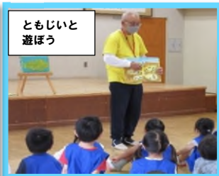
ともじいと遊ぼう