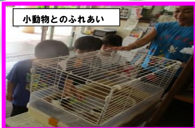
小動物とのふれあい