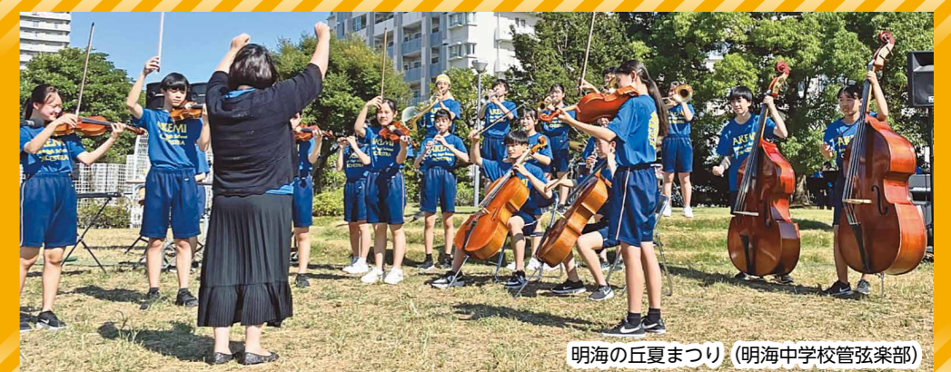
明海の丘夏まつり (明海中学校管弦楽部)