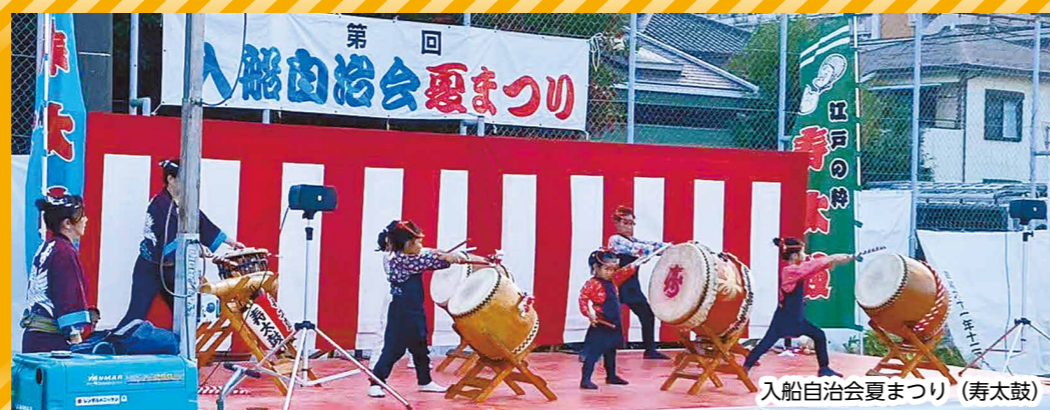
入船自治会夏まつり (寿太鼓)

大きなお祭りのほかに、今年はそれぞれの地域でもたくさんの催しが行われました。こうしたイベントにも子どもたちが手伝いや出し物などで参加し、会場を盛り上げました。皆さんも身近なお祭りなどに参加してみませんか。