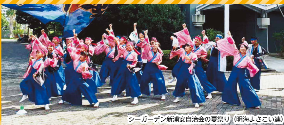
シーガーデン新浦安自治会の夏祭り (明海よさこい連)