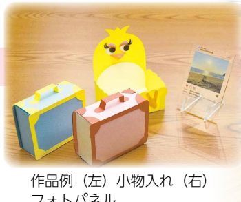
作品例(左)小物入れ(右)フォトパネル