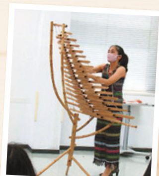
▲ベトナムの楽器、トルン