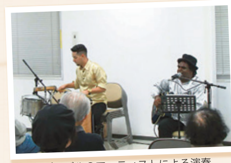
▲ブラジルのアーティストによる演奏

生活の中に古くから伝えられ、その地域や民族特有の性格をもった「民族音楽」。そんな音楽に触れる機会としてコンサートを開催しています。