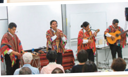
▲ペルーのアンデス音楽