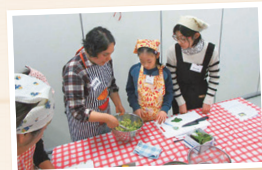
▲メキシコの料理、トルティーヤ作り