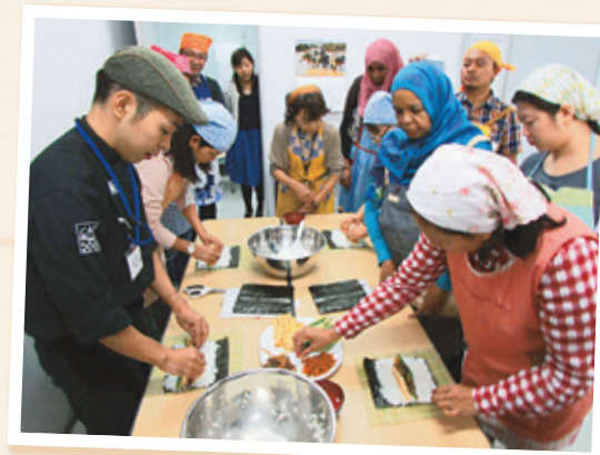
▲外国の方と和食作り

食にまつわる文化は、食材や調理法、食事のマナーなど、民族や国、風俗によって固有の特徴があります。食文化を通して、国や民族の文化を知る機会を作っています。