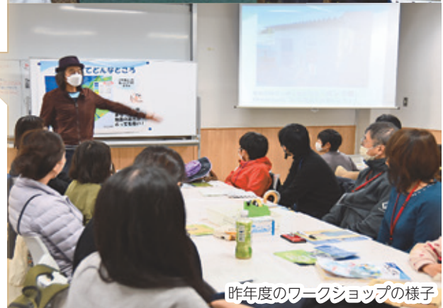
昨年度のワークショップの様子