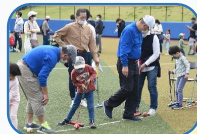
▶浦安スポーツフェア

市民の誰もがスポーツを楽しむことができるよう、スポーツをささえる人材・団体の育成・活用に取り組めます。