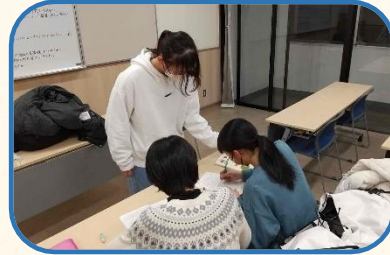
▶青少年自立支援 未来塾

学校や家庭、地域の連携・協力により地域の教育力の向上を図ることで、地域全体で子どもを見守り、育てる環境を整備していきます。