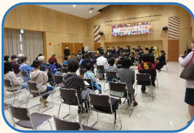
▲公民館のサークル 成果発表会

市民の学びと実践が循環し、地域の課題解決や持続的な発展につながるよう、公民館などの生涯学習施設を中心として学習成果を生かせる場や機会の充実を図ります。