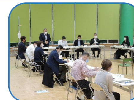
浦安型コミュニティ・スクール検証校による地域合同会議（明海小）

子どもや学校が抱える課題の解決や未来を担う子どもたちの豊かな成長のため、学校と地域の人々が目標やビジョンを共有し、子どもたちを育む「浦安型コミュニティ・スクール」の設置を推進します。