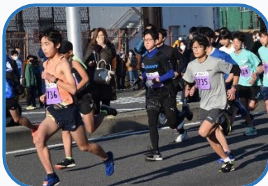
▶東京ベイ浦安シティ マラソン

年齢や性別、障がいの有無にかかわらず、市民の誰もが目標をもって競技スポーツに取り組めるよう、市民やスポーツ関係団体を支援します。