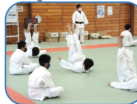
体力向上推進校の柔道の授業（見明川中）