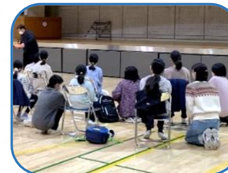
明海大学の留学生や教授等の協力で、外国語で「コミュニケーション」を図る。

未来の浦安を担う子どもたちを育成する一助として、自ら学び、体験することによる"気づき"や、専門知識・技術に触れることによる知的好奇心の向上などをねらい、市内大学等の協力を得て、大学キャンパスを会場とした「うらやすこどもクエスト」を開催します。