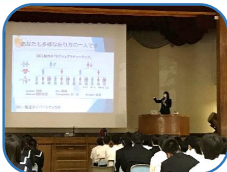
一〇〇〇か所ミニ集会にて、講師を招き、多様な性のあり方について講演を行う。（堀江中）

子どもの人権が尊重される社会の実現に向け、小・中学生を対象とした人権教育を推進します。「自分の大切さとともに他の人の大切さを認める」ことのできる児童生徒の育成のため、道徳科の学習を要として学校の教育活動全体を通して、人権感覚を身に付けられるようになります。