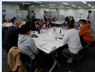
テーマ：水辺・水面の利用