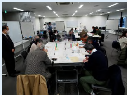
テーマ：水・自然環境