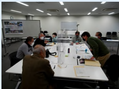
テーマ：歴史・文化