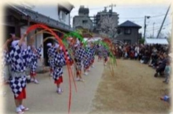
新川さくら館前の催し物

桜の花が見頃を迎える時期に、新川千本桜の拠点である新川さくら館と新川沿川を会場に新川千本桜の会の主催により江戸の風情の中で桜を楽しむイベントとして「新川千本桜まつり」が開催されます。