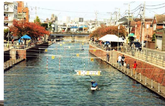
〈Cゾーン江川橋付近〉 千葉県カヌースラローム大会 ▶