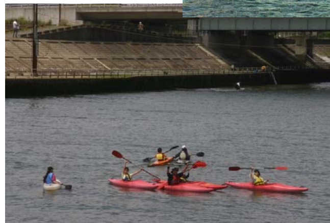
〈D2ゾーン 日の出橋付近〉 ◀ 練習風景