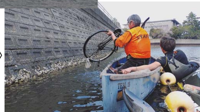
〈D1-1 排水機場付近〉 境川クリーンアップ ▶