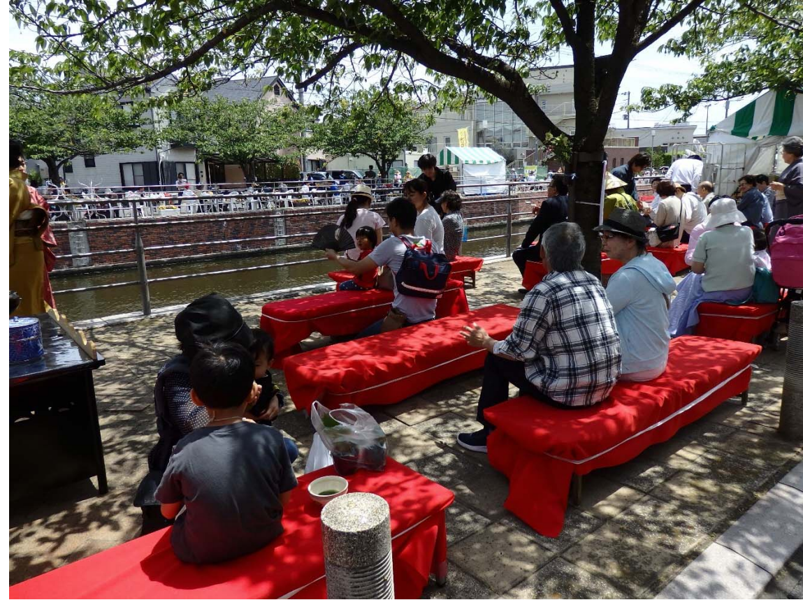
カフェテラスin境川でのイベント(野点)の風景