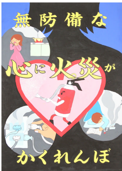
第33回浦安市防火ポスター展 中学生の部 市長賞作品