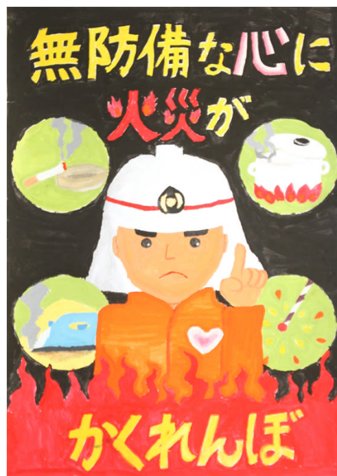
第33回浦安市防火ポスター展 小学生の部 市長賞作品