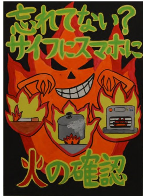
第36回浦安市防火ポスター展 小学生の部 市長賞作品