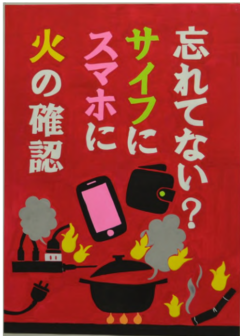
第36回浦安市防火ポスター展 中学生の部 市長賞作品