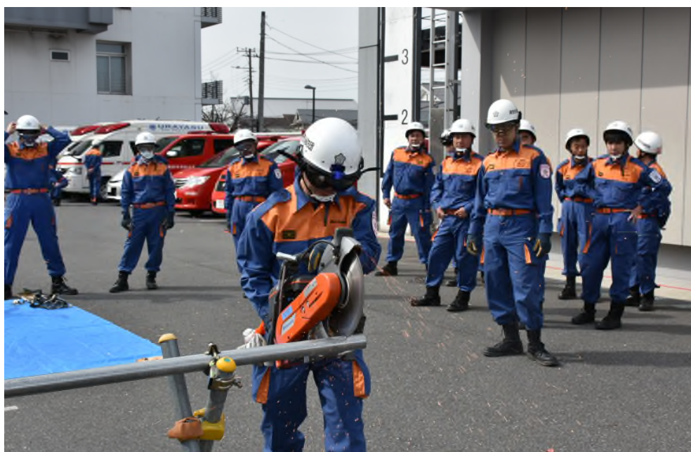
消防団・消防署合同訓練(資機材取扱い訓練)