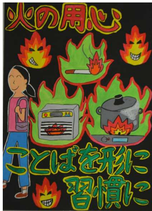
第35回浦安市防火ポスター展 小学生の部 市長賞作品