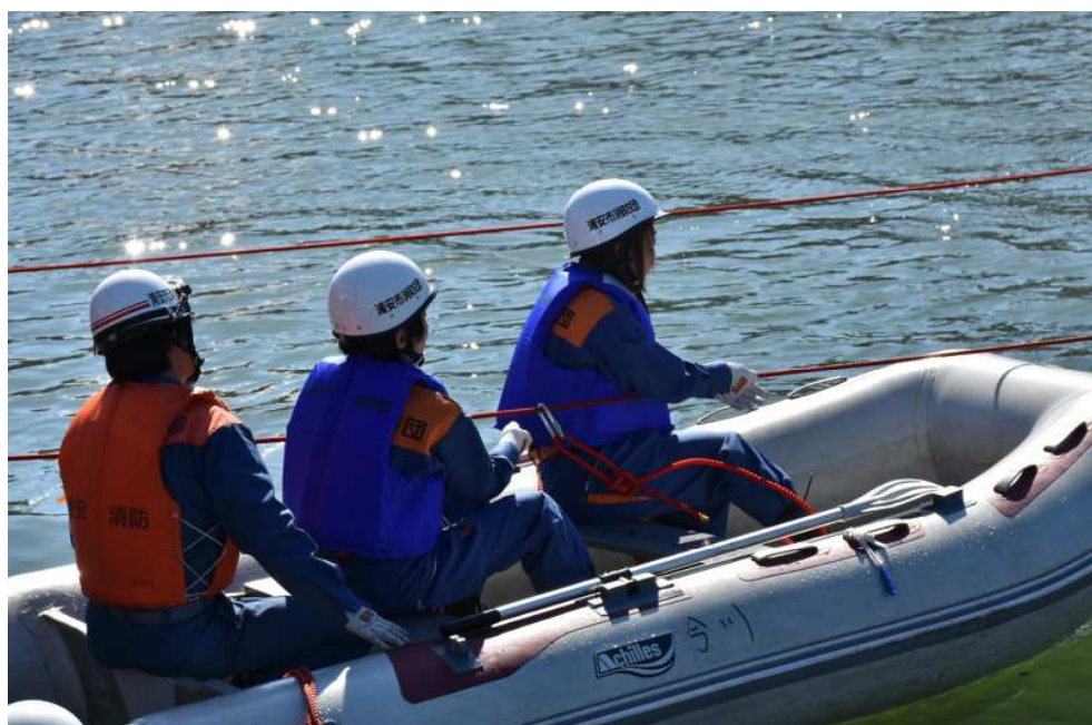
消防団・消防署合同訓練(水防訓練)