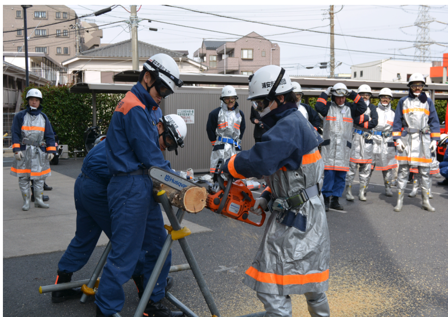
消防団・消防署合同訓練(救助訓練)