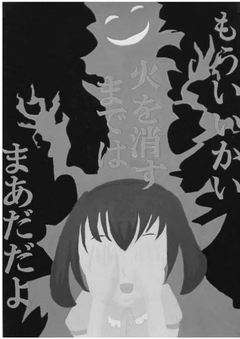
第32回浦安市防火ポスター展 中学生の部 市長賞作品