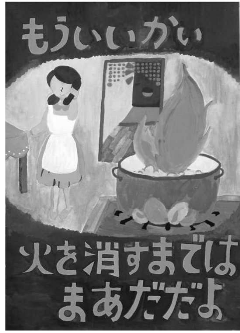
第32回浦安市防火ポスター展 小学生の部 市長賞作品