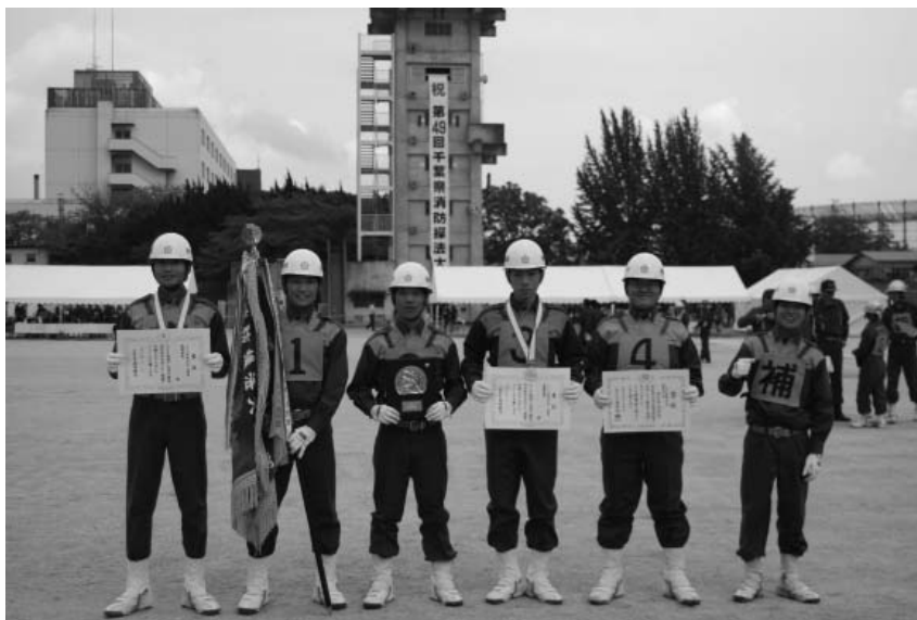
第 49 回千葉県消防操法大会ポンプ車の部最優秀賞受賞