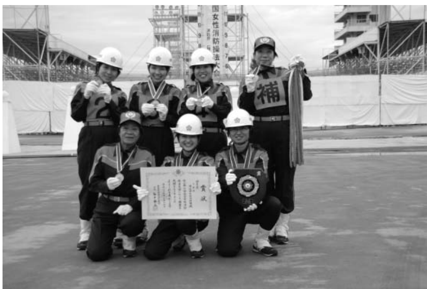
第 21 回全国女性消防操法大会優秀賞受賞