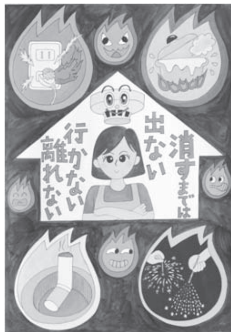
第 30 回浦安市防火ポスター展 小学生の部 市長賞作品