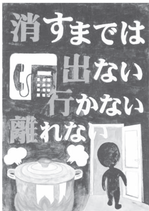
第 30 回浦安市防火ポスター展 中学生の部 市長賞作品