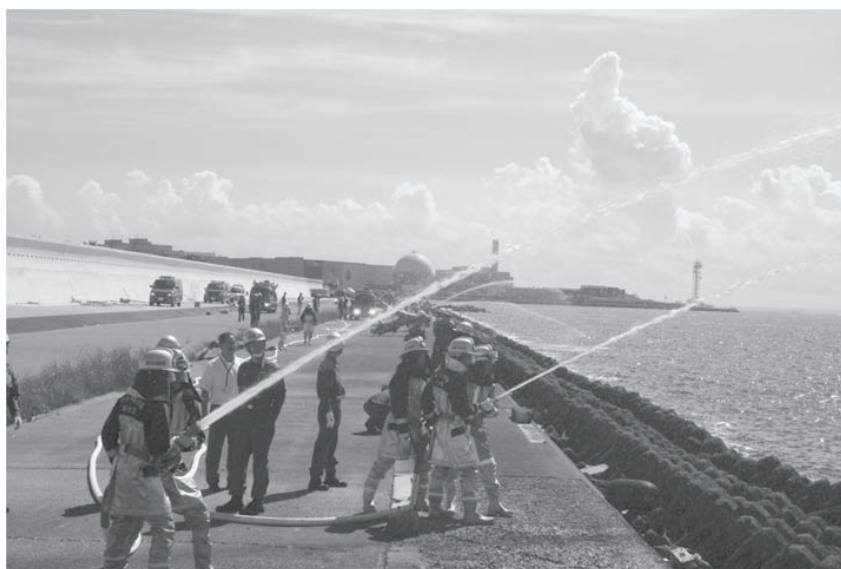
平成 24 年度消防署・消防団合同訓練