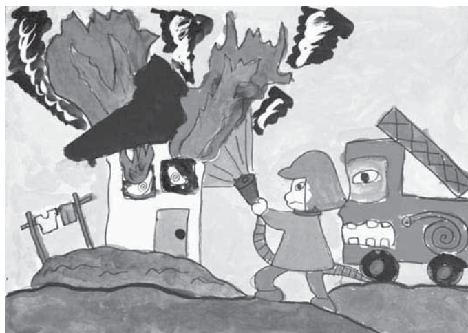
第29回浦安市防火ポスター展 小学生の部 市長賞作品