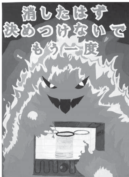
第29回浦安市防火ポスター展 中学生の部 市長賞作品