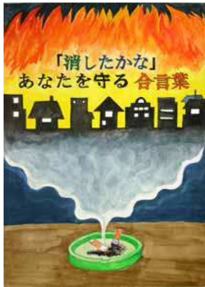
第28回浦安市防火ポスター展 中学生の部 市長賞作品