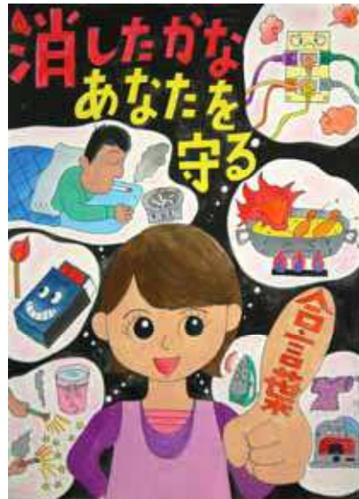
第28回浦安市防火ポスター展 小学生の部 市長賞作品