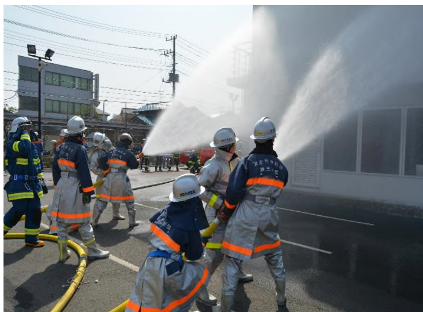
消防団・消防署合同訓練