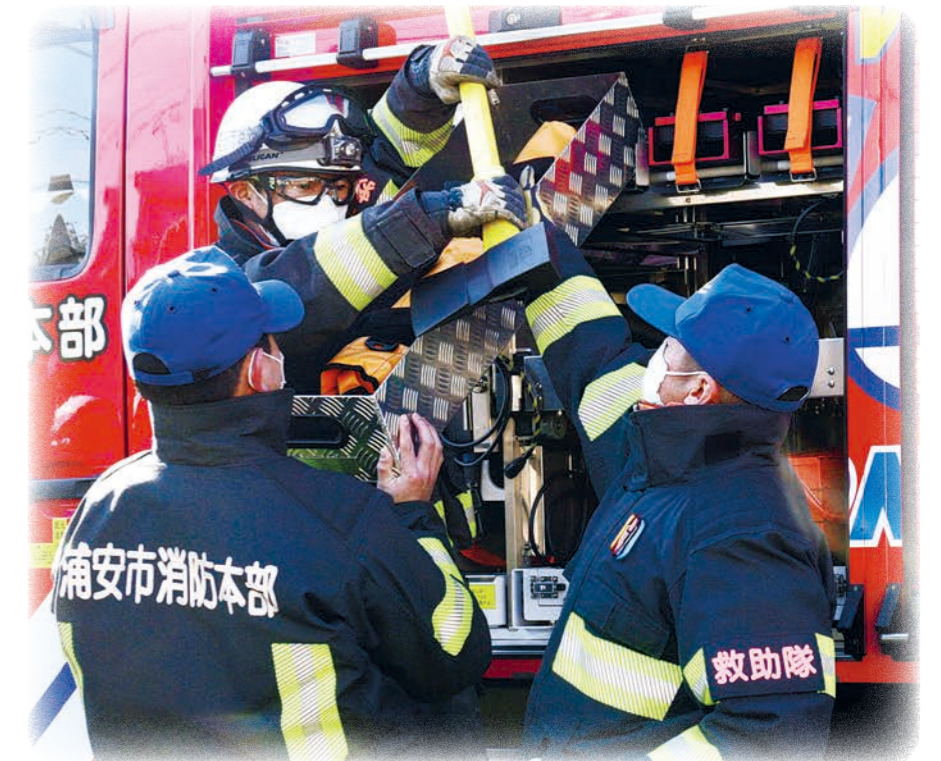
▲日々まちの安全のために働くレスキュー隊