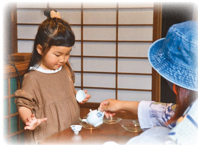
▲昔のまちを再現した展示場でさまざまな体験ができる郷土博物館