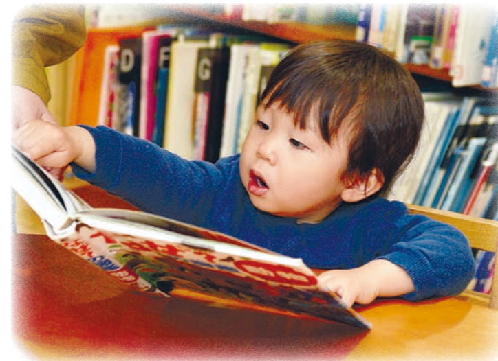
▲さまざまな学びを提供