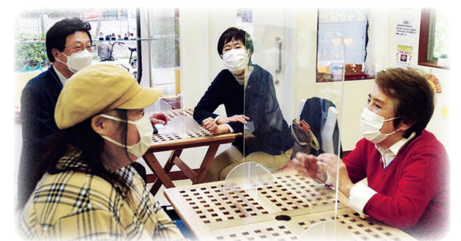
▲交流を楽しむ市民の憩いの場 当代島ぽっかぽか