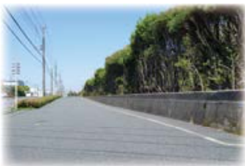
太陽の丘公園脇の道路

オミクロン株が全国的に猛威を振るっていましたが、現在、市内の新規感染者数は減少傾向