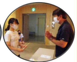
ジュニア学芸員証 授与