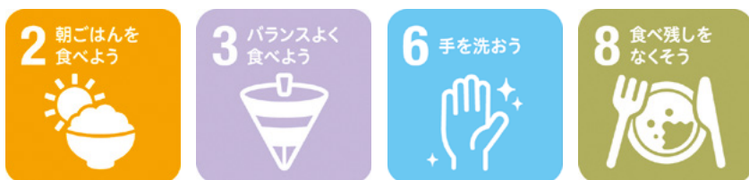
食育ピクトグラム