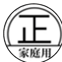
家庭用特定計量器技術 基準適合マーク