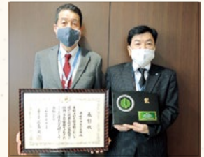
左から八田生涯学習部長、川口中央公民館長

浦安市中央公民館は「『古き』と『新しき』の共存」をキャッチフレーズに、市民の学習活動に大きく貢献してきたことが認められ、文部科学省から優良公民館として表彰されました。