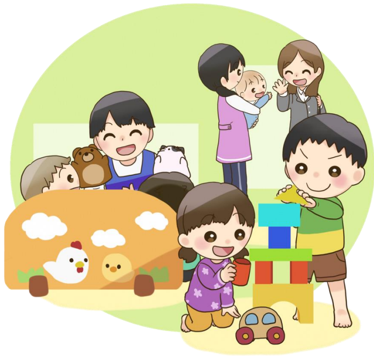
イラスト 村上めい