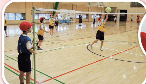
▲ネット型のボールゲーム（小学3年生）飛んできたボールを落とさないようにキャッチすればラリーは続く（東小学校）

また、作戦を考え、それを試すなど、友達と協力してゲームを行う楽しさを感じられるようにしています。