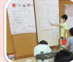
◀「体を助ける免疫力」をテーマに調べたことを模造紙にまとめ、発表する（高洲北小学校）