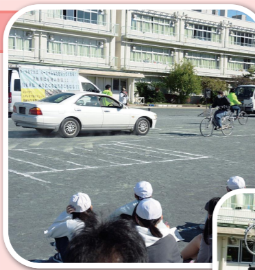
▶車とぶつかって壊れてしまった自転車を見せる（南小学校）

スタントマンが交通事故の再現を実演して見せるスケアードストレイトを行いました。参加した子どもたちは交通事故の恐さや交通ルールを守る大切さを感じたようです。「右、左、後ろを見て、事故が起きないようにしたい」と代表児童が感想を述べました。