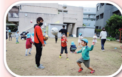
▲ボールを上に向けて、手をたたいてからボールをキャッチする（若草認定こども園）

この日はバルドール浦安の選手が来園し、サッカー教室が行われました。汗をかきながらボールを追いかけて、終わった後は「ボールを蹴るのが楽しかった」と満足そうでした。