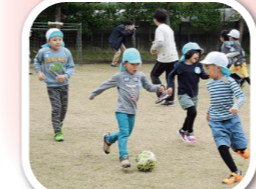
◀「ボールにさわりにいこう」というゲームの合図で（若草認定こども園）