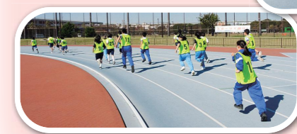
▲1200mの部のスタート。この他に400m、2000mの部があり、個人の力に応じた距離を選んで走る