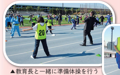
▲教育長と一緒に準備体操を行う

コロナ禍で開催が危ぶまれましたが、今年度は陸上競技場でマラソンを行いました。快晴の中、自分の力を出し切っていました。