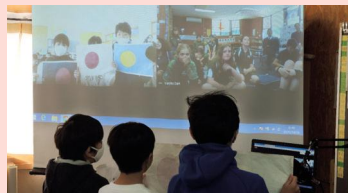
「日本の国旗はどれですか？」とオーストラリアの友達にクイズを出す

オリンピック・パラリンピック教育の一環として、オーストラリアの学校とオンラインで交流を図りました。クイズなどを通してお互いの国のことを教え合い、交流を深めていました。