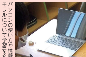
パソコンについての使い方や情報

ログインの方法や使い方の注意点、危ないHPの見分け方などを学習したり、会議や投稿を体験したりしました。