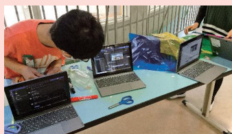
他のグループの作品を見て、質問したりアドバイスをしたりとパソコンを使って対話しながら作業する