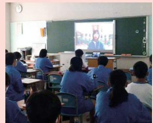
立候補者の演説を教室で視聴する

全学年の生徒が体育館に集まるのを避けるため、立候補者はホールで演説を行い、その様子を各教室に配信し、視聴しました。