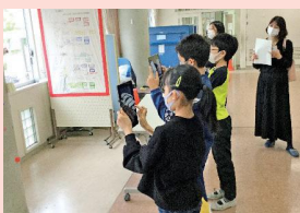
自分たちで作った飾りを撮影し、写真をクラス全員で共有する

校内のいろいろな場所に分かれて、来校者が楽しい気持ちになれるような飾りつけを工夫して作りました。教師の指示や他のグループの様子を、パソコンを使ってリアルタイムに確認しながら作業を行いました。