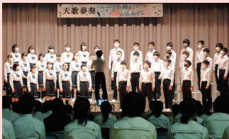
体育館で発表し、同学年の発表は体育館で聴く

毎年、全校生徒が集まって行う合唱祭を、今年度は3密を避けるため一学年だけが体育館に集まり、残りの2つの学年の発表は、タブレット型パソコンとICTカートを使って教室で鑑賞しました。