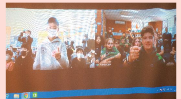
オーストラリアと日本とで「あっち向いてホイ」をオンラインで行う