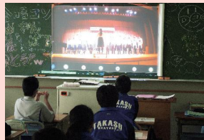
他学年の発表は教室で鑑賞する