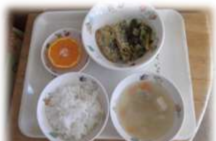
魚のパン粉焼き、小松菜の煮びたし、さつまい