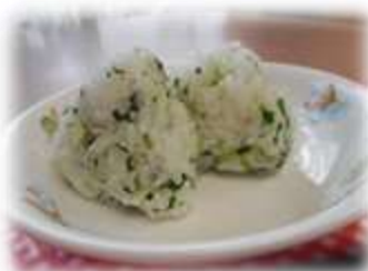
青菜としらすのおにぎり