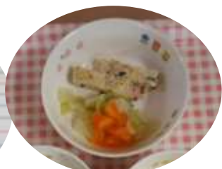
チキンミートローフ