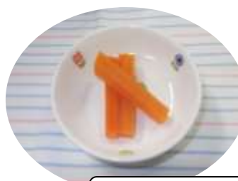
にんじんスティック