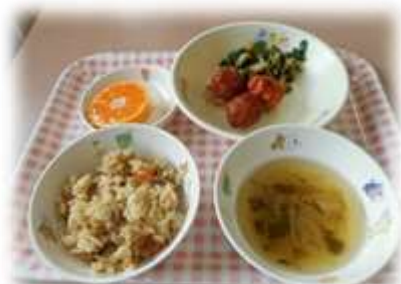
肉団子の甘辛煮、ほうれん草お浸し すまし汁 果物