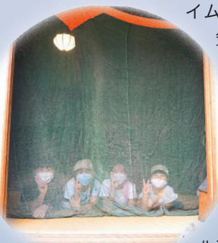
▲蚊帳に入って記念撮影

20年代の一番通り（今の堀江のフラワー通り）にタイムスリップしたような雰囲気になりました。