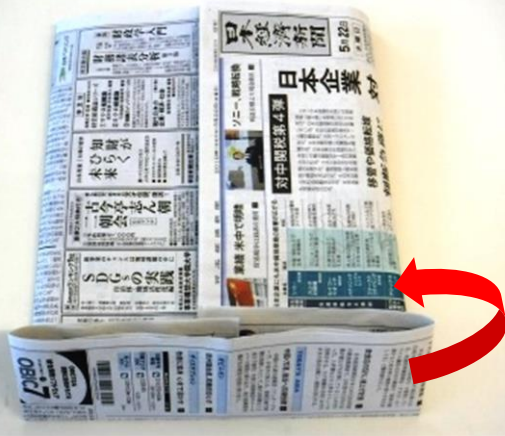
9. 下から6 cm程度折り曲げます