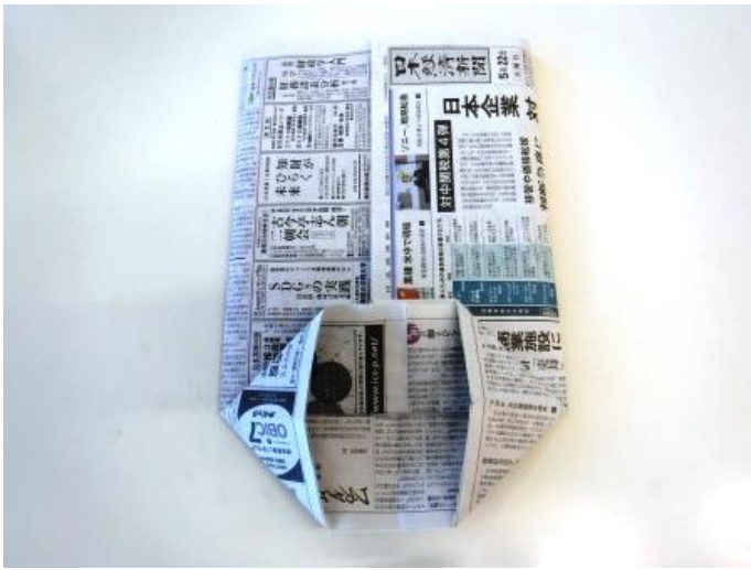
11. しっかり折り目を付けます