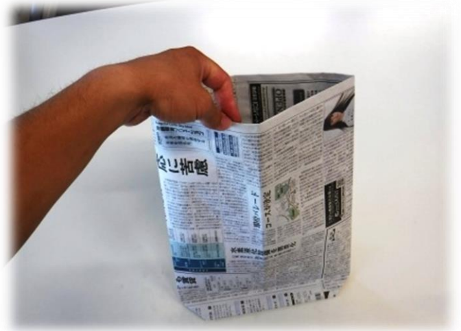
14. 上部を広げて袋状にします