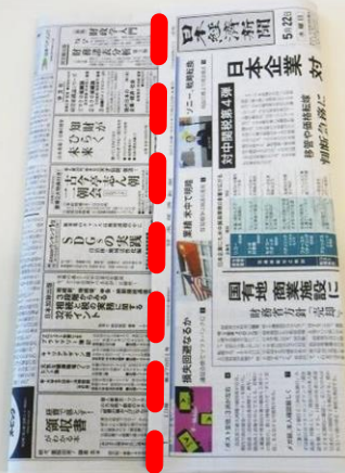
8. 重なる部分をのり付けします