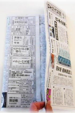
7. もう片方を折ります