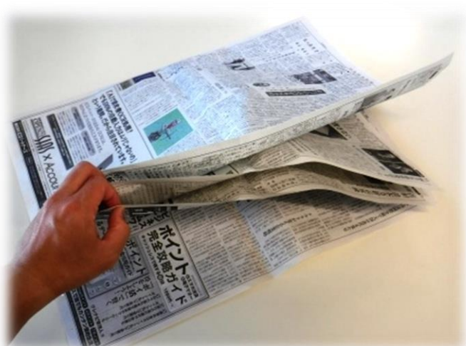
3. 2と同様に端をのり付けします