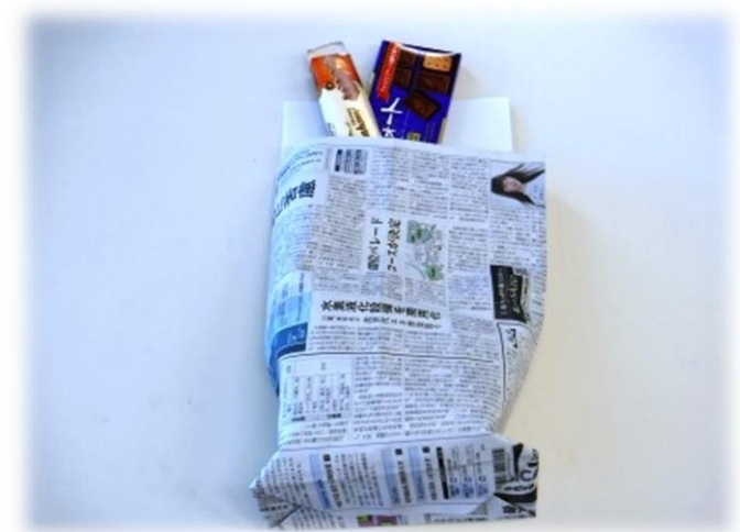
16. 雑紙を分別するのに利用しましょう！