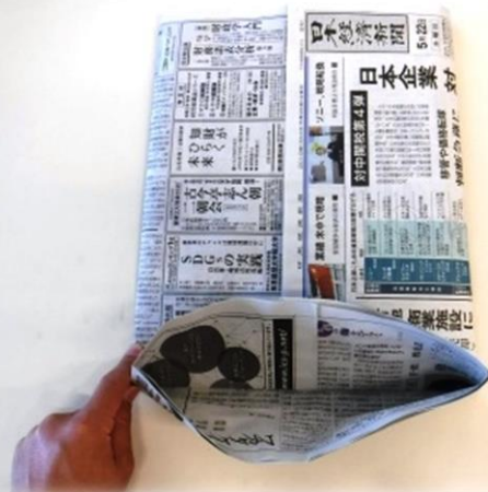
10. 折り曲げた部分を広げます