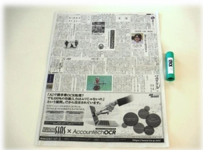
1. 二枚重ねの新聞紙とのりを用意します

浦安市ではごみの減量・再資源化のために4R（Refuse ことわる、Reduce へらす、Reuse 再利用、Recycle 再生利用）を推進しています。お菓子の箱やメモ用紙、学校のプリントなどは「雑紙（ぞつがみ）」として分別し、リサイクルができます。デパートなどの紙袋を利用したり、新聞紙で袋を作って、雑紙を分別してごみの減量・再資源化にチャレンジしてみましよう！