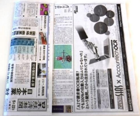
6. まず片側を内側に折ります