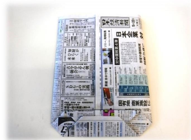
13. 下半分を12で折った部分に重なるように折り、のり付けをします