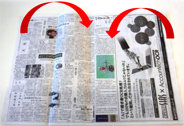
5. 左右が3 cm程度重なるように内側に折ります