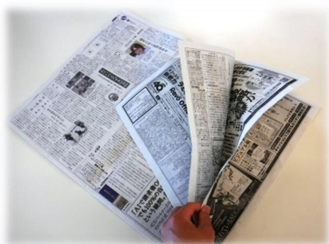
2. 新聞紙の3辺をのり付けします