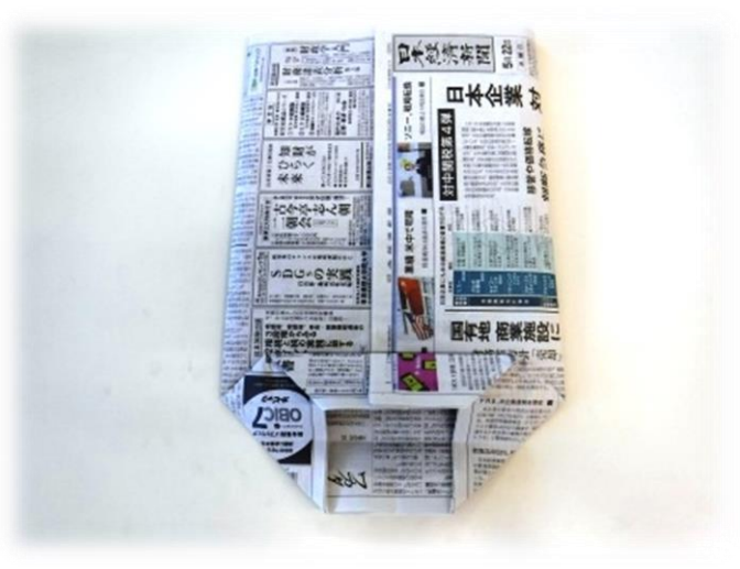
12. 上半分を折ります