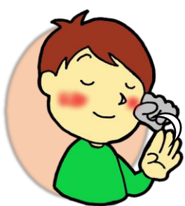
よろしくお願いします