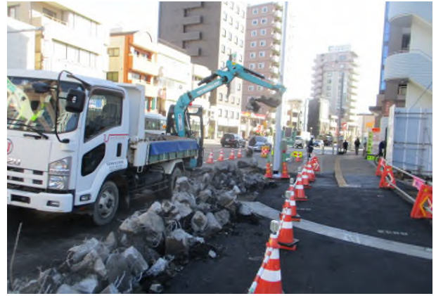
側溝の撤去（やなぎ通り）