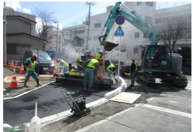
歩道の整備（浦安小学校付近）