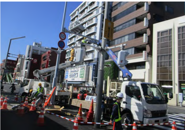
信号機の移設（やなぎ通り）