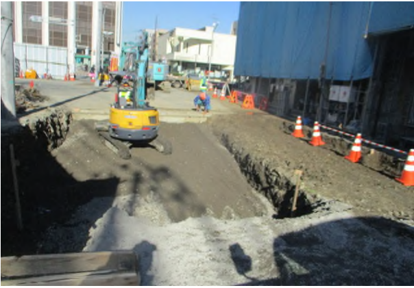
道路築造（浦安小学校側より）