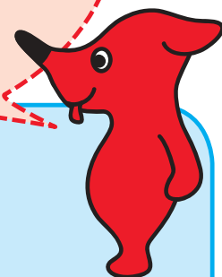
千葉県 マスコットキャラクター チーパくん

ヘルプカードの携帯方法は、障害種別、状況、考え方によって異なります。「財布や定期入れに入れておく」「ケースに入れてカバンの外に取り付ける」等して、持ち歩きましょう