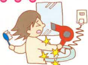
コードを曲げたり 引っ張ったりする