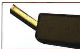
上に変形したコネクタの外観（上） その内部をみたもの（右）