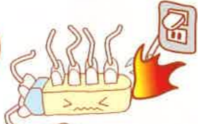
定格容量を 超えて使用する