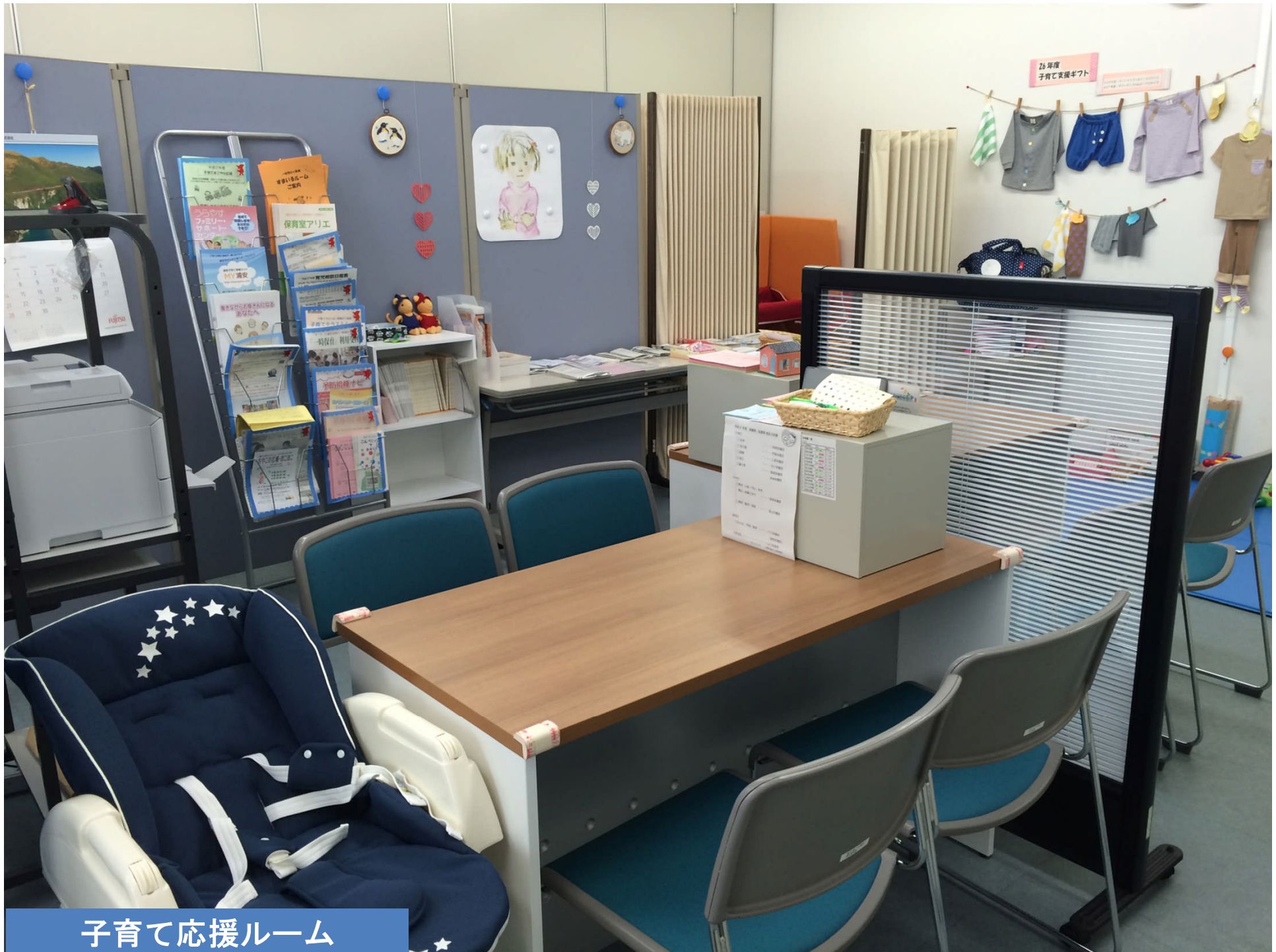
子育て応援ルーム