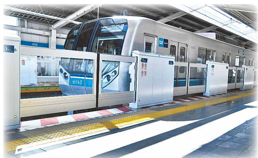
浦安駅に設置されるホームドア

日に日に春らしくなってきました。寒暖の差で体調を崩さないようお気を付けください。以前は漁師町であった浦安ですが、目覚ましい発展の基礎として鉄道の開通があります。