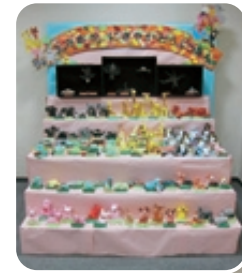
（上）幼稚園作品 （下）小学校図画工作平面作品