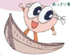
（郷土博物館マスコットキャラクター）

かつて、浦安では海苔作りが盛んでした。郷土博物館では、冬の間、もやいの会（文化・技術伝承などの博物館ボランティア）の方々のご指導で、海苔すきの体験教室を行っています。市内の公立小学校4年生は全員体験をします。