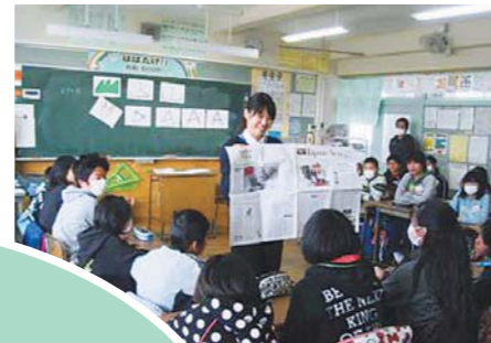
中学校英語教員による南小学校での出前授業