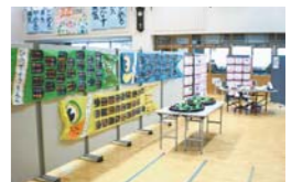
合同作品展の様子

また、定期的に「合同作品展」を開催したり、年長児・5歳児が小学校1年生の教室で、授業を受ける「ミニ授業体験」を実施したりしています。こうした取組は大人にとっても学びのつながりと成長がわかるよい機会となっています。