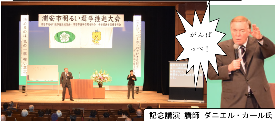
記念講演 講師 ダニエル・カール氏

明るい選挙啓発ポスター・標語の入選者表彰と選挙功労者の表彰後、大会決議を挟み記念講演が開催されました。受賞者のみなさんおめでとうございます。