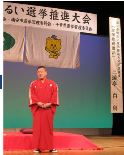
三遊亭白鳥師匠の講演