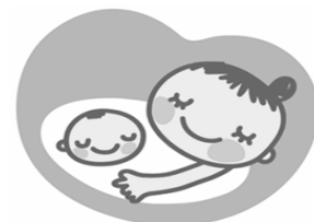
マタニティマーク