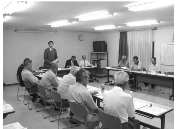
懇談会風景（場所：まちづくり事務所）